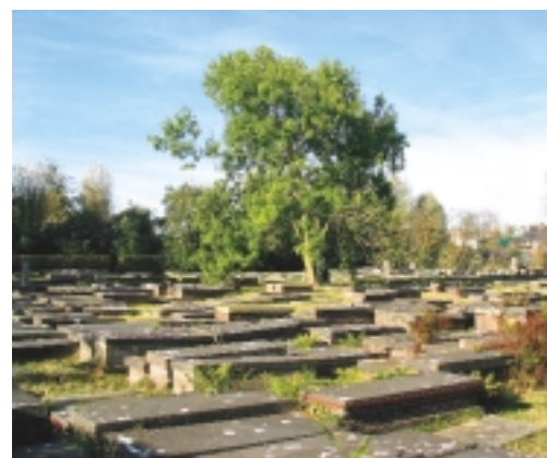
Beth Haim te Ouderkerk aan de Amstel: de kracht van dit gedeelte van de begraafplaats is de eenvoud en de grote eenvormigheid van de grafmonumenten